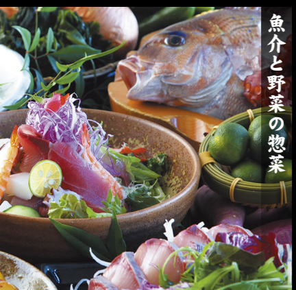
魚介と野菜の惣菜