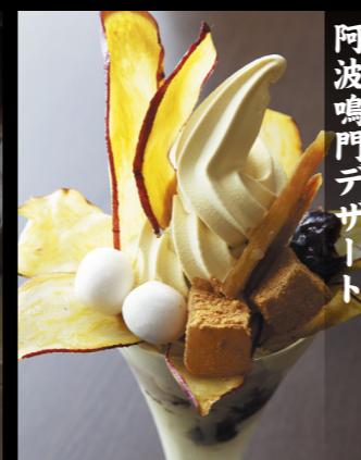
阿波鳴門デザート