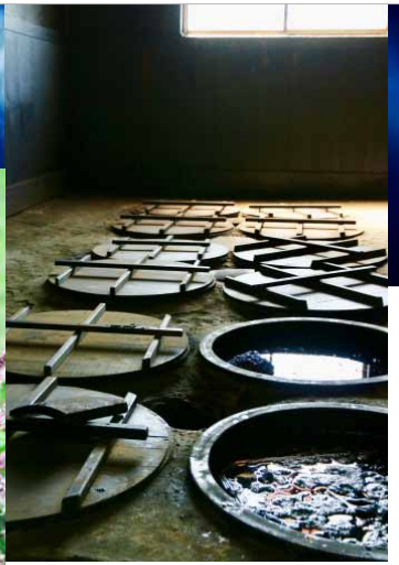
▲伝統的な藍染 ▼藍の花

藍には抗菌・消臭・防虫・保温などさまざまな効能があり、古来より重宝されてきました。是非マスクにも藍染を取り入れて、効能とお洒落の両方を楽しんでみませんか。